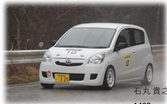
石丸 貴之 選手 140PowerミラV