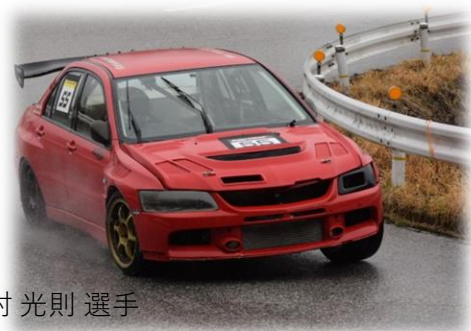
志村 光則 選手 志村空調ランサー